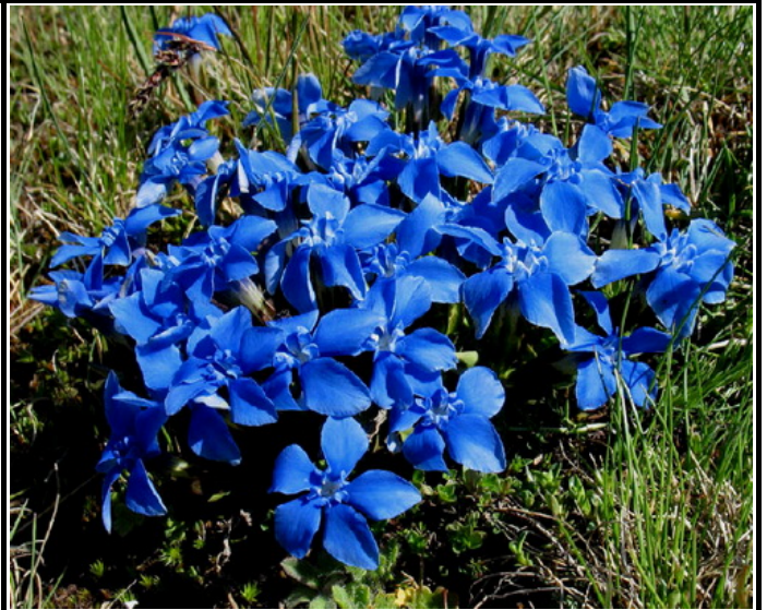
GENTIANA VERNA - Portamento