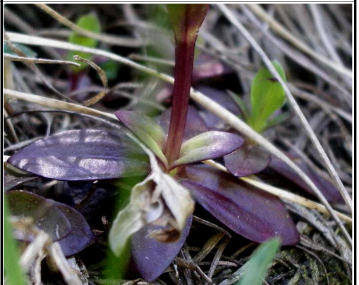
GENTIANA VERNA – Foglie basali