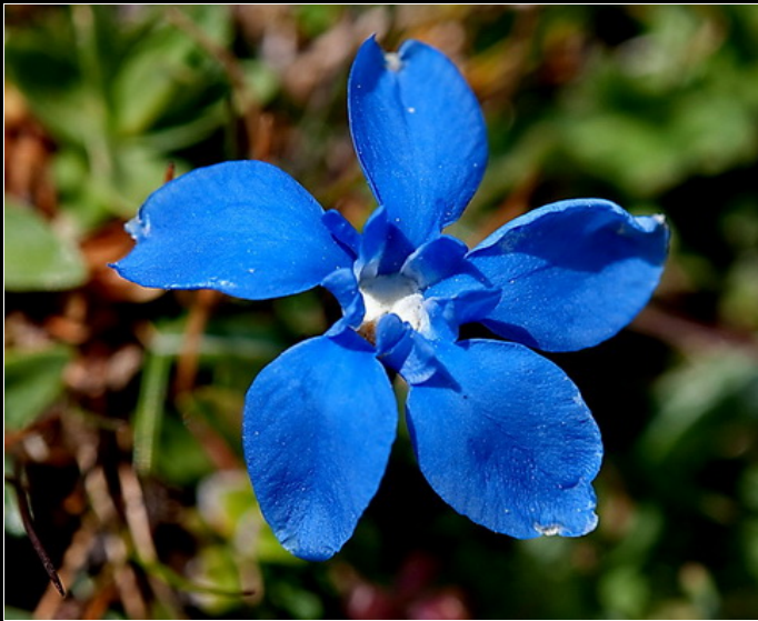
GENTIANA VERNA – Fiore - Fauce