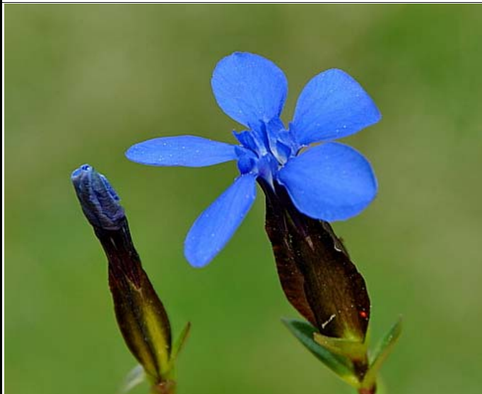
GENTIANA VERNA – Corolla e calice alato