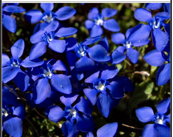
Cima Trappola - 23-05-2010